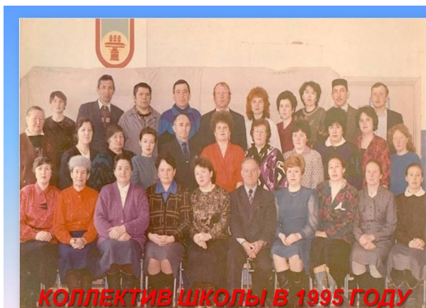
КОЛЛЕКТИВ ШКОЛЫ В 1995 ГОДУ

Одной из серьезнейших проблем стало трудоустройство педагогов 3-х школ. К счастью она