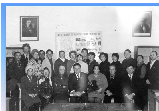
КОЛЛЕКТИВ ШКОЛЫ В 80-Е ГОДЫ

Кичкетанской семилетней школы. Педагогический коллектив организовывал процесс обучения и воспитания детей близлежащих сел Варзи, Варзи-Омга, Балтачево и Балтачевского Детского дома. Выпускники школы успешно применяли свои знания в сельскохозяйственном производстве, поступали в средние и высшие учебные