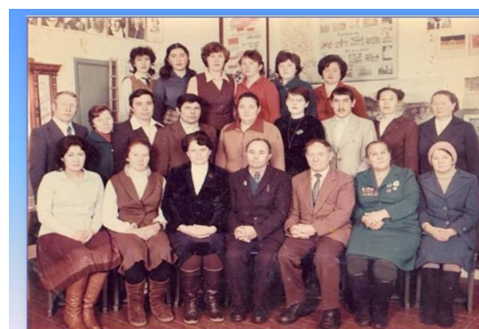
КОЛЛЕКТИВ ШКОЛЫ В 1985 ГОДУ

Строительство Нижнекамской ГЭС вызвало угрозу затопления нескольких сел, жители которых переселялись в с. Кичкетан. Одним из важнейших социальных объектов стремительно растущего села стала школа. Современное здание с хорошо укомплектованными предметными